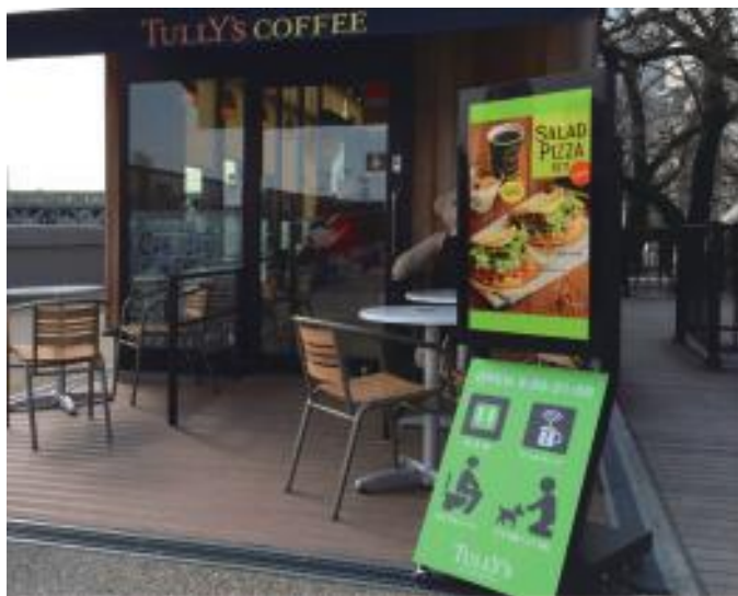
【タリーズコーヒージャパン様 設置事例】